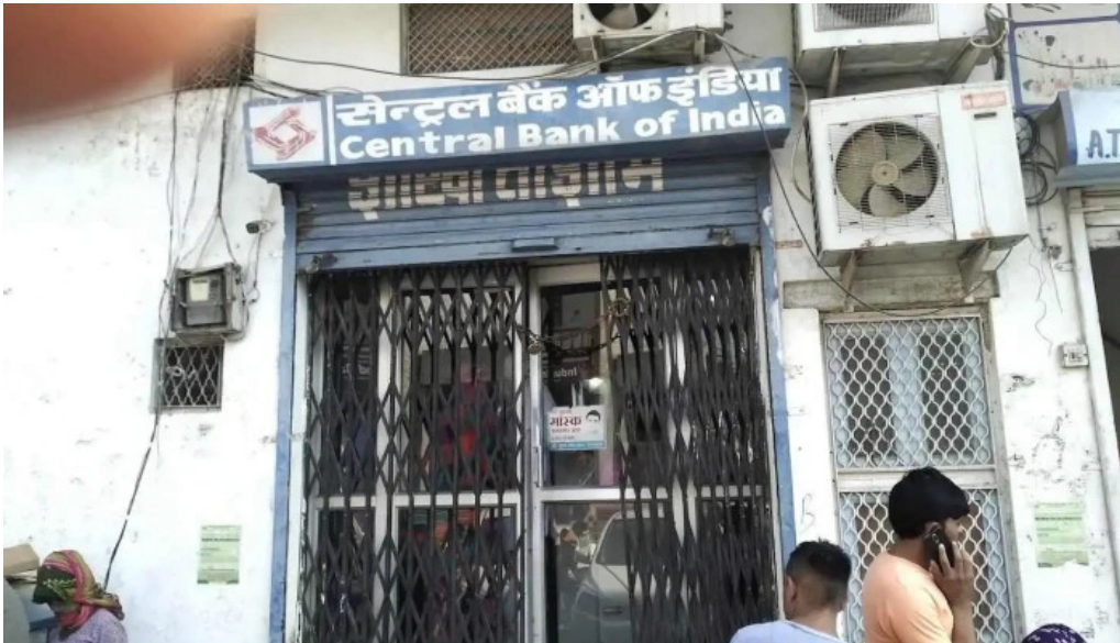
Central bank of india tosham branch bhiwani ?????? ??????